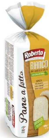
Pane affettato bianco con olio d'oliva Roberto.