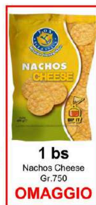
1 bs Nachos Cheese Gr.750 OMAGGIO

Assortimento misto di patatine e snack Aperiprimavera Fox.