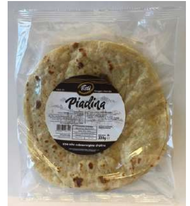
Piadina con olio extra vergine di oliva Tissi.