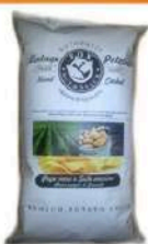
1 BUSTA VINTAGE PEPE NERO GR.300