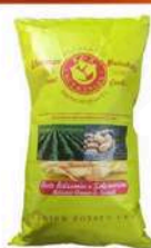
1 BUSTA VINTAGE ACETO BALSAMICO GR.300