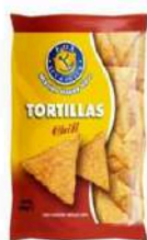
1 BUSTA TORTILLAS CHILI GR.450