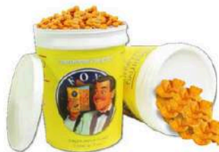
1 VASO RICE CRACKERS GR.1000