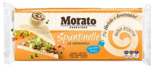
Spuntinelle Morato pane a fette per tramezzini.