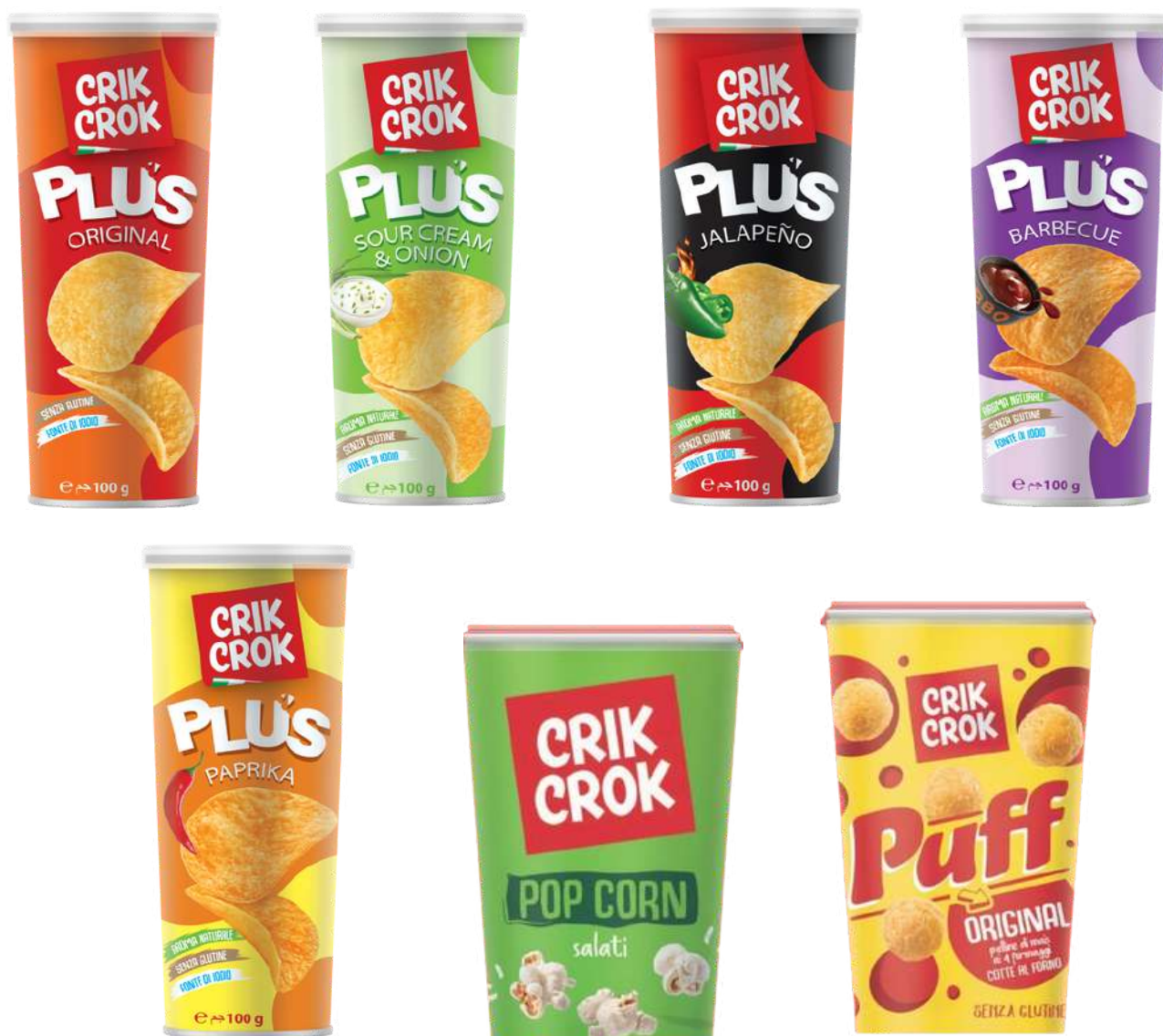
Patatine assortite in tubo Crik Crok.