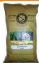
1 BUSTA VINTAGE SALE MARINO GR.300