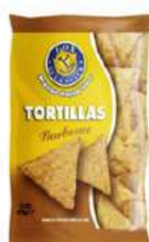
1 BUSTA TORTILLAS BBQ GR.450