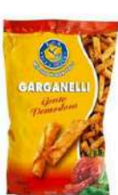
1 BUSTA GARGANELLI GR.300