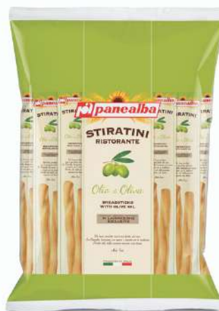
Grissini all'olio di oliva monoporzione.