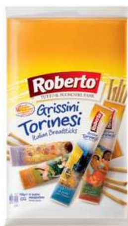
Grissini Torinesi monoporzione.