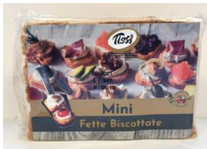
Mini fette biscottate Tissi.