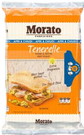
Tenerelle Morato pane a fette per toast.