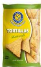
1 BUSTA TORTILLAS NATURALI GR.450