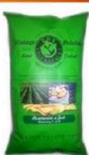
1 BUSTA VINTAGE ROSMARINO GR.300