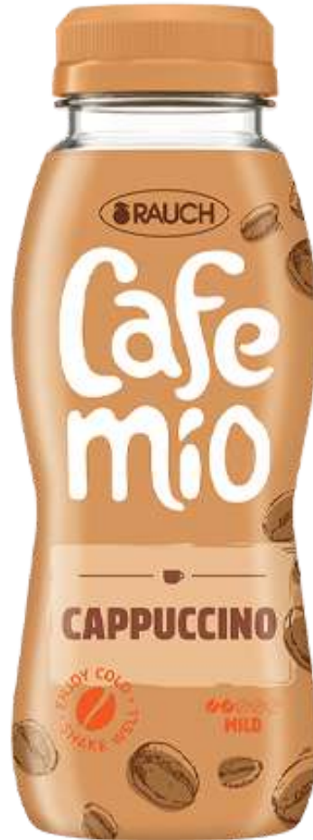
Caffè freddo gusto cappuccino Rauch.