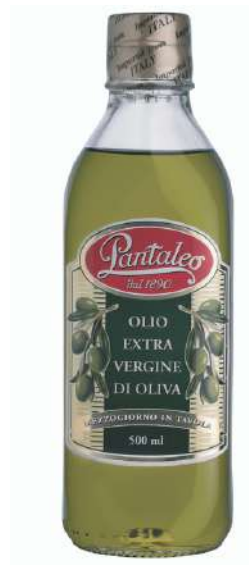
Olio extra vergine di oliva Pantaleo.