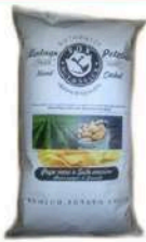
1 BUSTA VINTAGE PEPE NERO GR.300