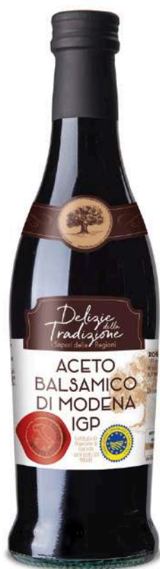
Aceto balsamico di Modena I.G.P. Delizie della Tradizione.