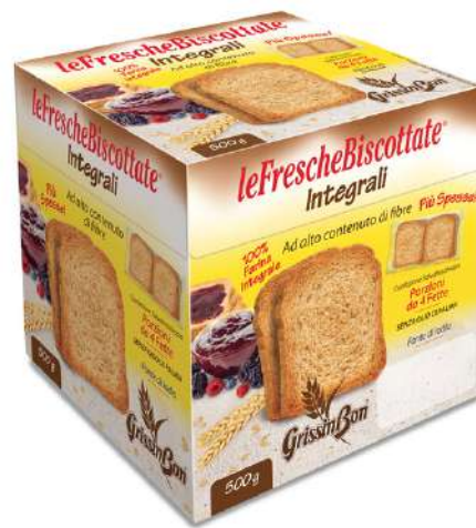
Fette biscottate classiche e integrali Grissinbon.