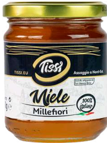
Miele di millefiori Tissi.