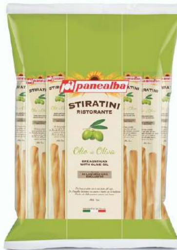
Grissini stiratini all'olio d'oliva monoporzione Panealba.