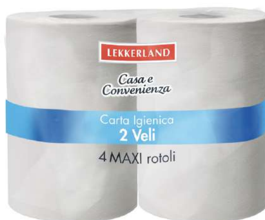
Maxi rotoli di carta igienica a 2 veli Lekkerland.