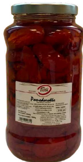
Pomodorotto in vaso Tissi.