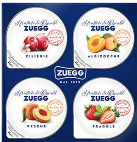
Confetture Zuegg monoporzione assortite alle ciliegia, albicocca, pesca e fragola.