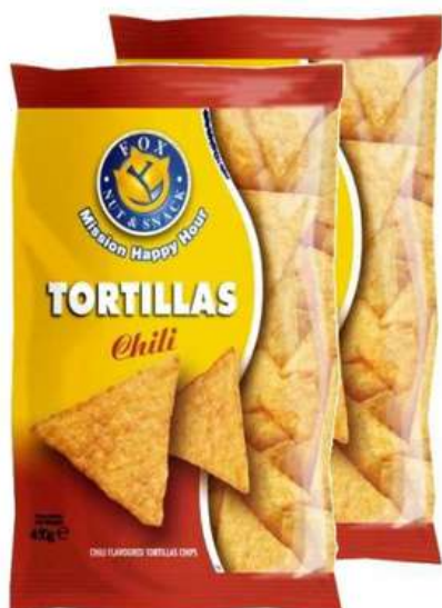
Patatine tortillas al gusto chili.