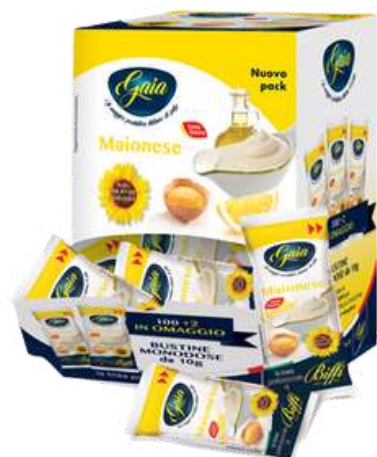
Maionese in bustine monodose.