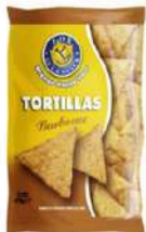
1 BUSTA TORTILLAS BBQ GR.450