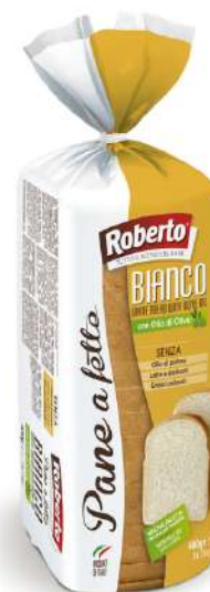
Pane bianco affettato con olio di oliva Roberto.