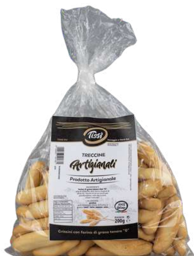
Trecchine corte artigianali.