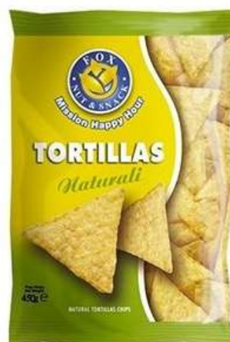
Patatine tortillas naturali.