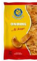
1 BUSTA ONDINE GR.250