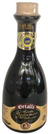
Aceto balsamico di Modena I.G.P. Ortalli.