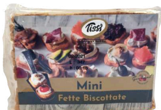
Mini fette biscottate.