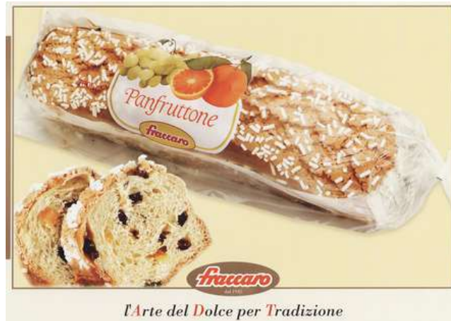
Panfruttone con uvetta Fraccaro.