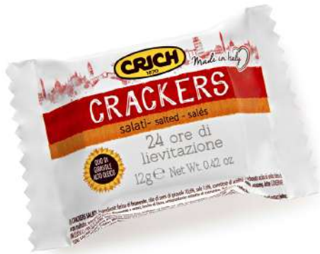
Crackers salati monoporzione Crich.