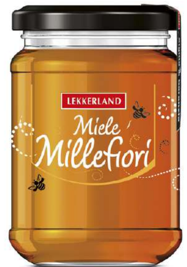
Miele di millefiori Lekkerland.