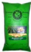
1 BUSTA VINTAGE ROSMARINO GR.300