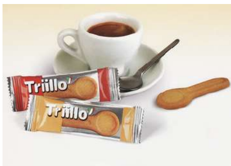
Biscottini da caffè in monoporzione Triillo.