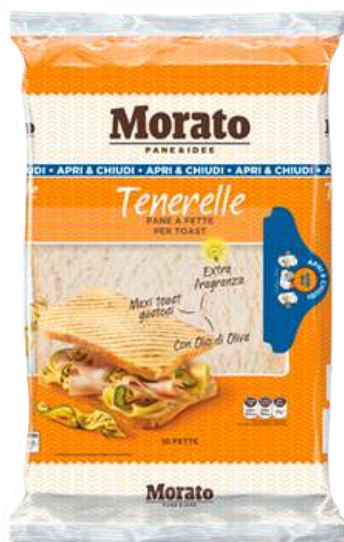
Tenerelle Morato pane a fette per toast.