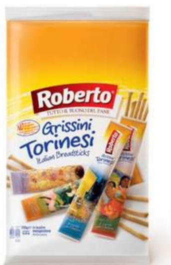
Grissini torinesi monodose Roberto.