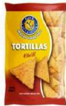
1 BUSTA TORTILLAS CHILI GR.450