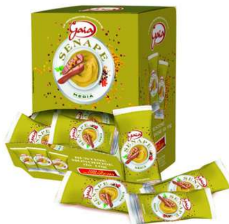
Senape in bustine monodose.