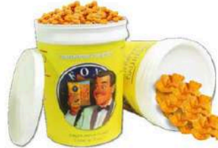
1 VASO RICE CRACKERS GR.1000