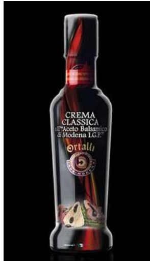
Crema classica all'aceto balsamico di Modena I.G.P. Ortalli.