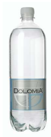
Acqua Dolomia minerale frizzante del Parco delle Dolomiti friulane.