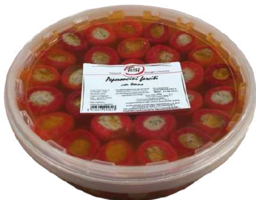
Peperoni farciti con tonno Tissi.