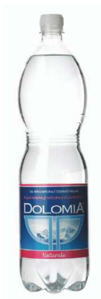
Acqua Dolomia minerale naturale del Parco delle Dolomiti friulane.