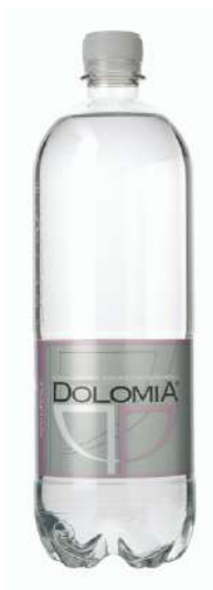
Acqua Dolomia minerale naturale del Parco delle Dolomiti friulane.