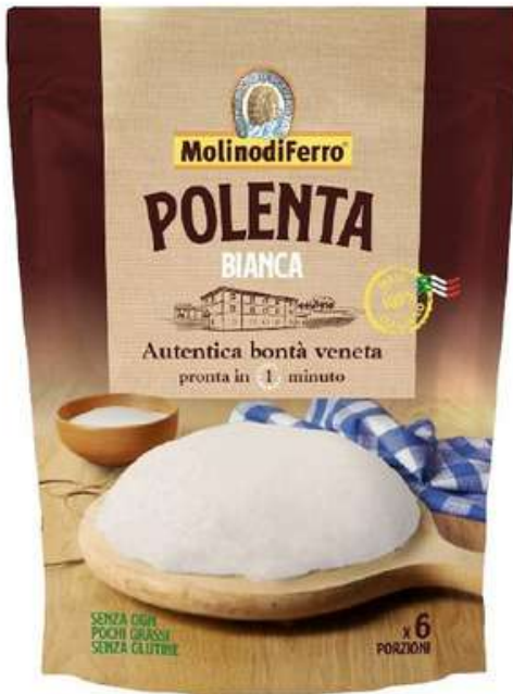
Farina per polenta bianca istantanea Molino di Ferro.