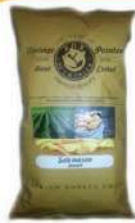
1 BUSTA VINTAGE SALE MARINO GR.300