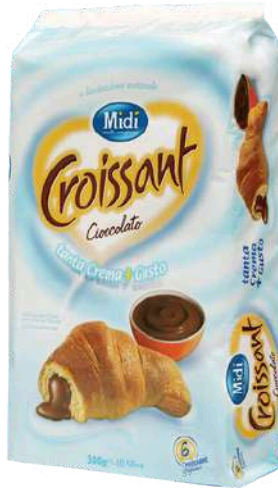
Croissant al cioccolato Midi.