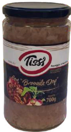
Preparato gastronomico con brovada Tissi.