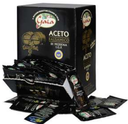
Aceto balsamico di Modena IGP in bustine monodose.