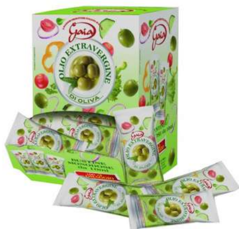
Olio EVO in bustine monodose.