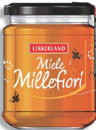
Miele di millefiori Lekkerland.