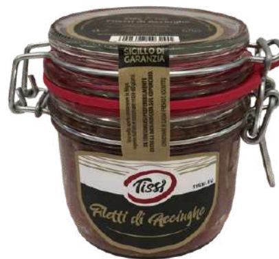
Filetti di acciughe.