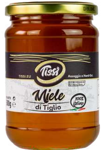
Miele di tiglio Tissi.