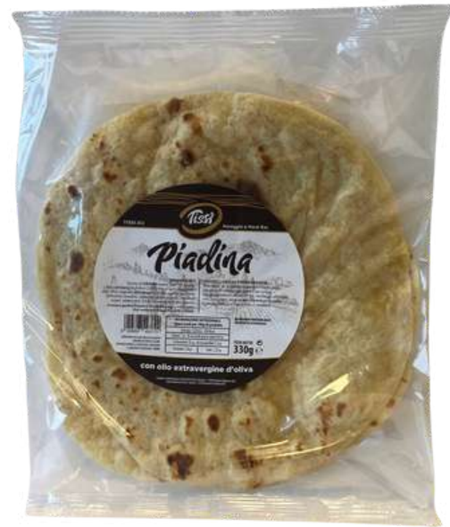
Piadina con olio extra vergine di oliva.