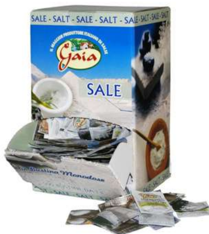
Sale in bustine monodose.