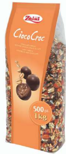
Ciocolatini al latte con ripieno di cereali Zaini.