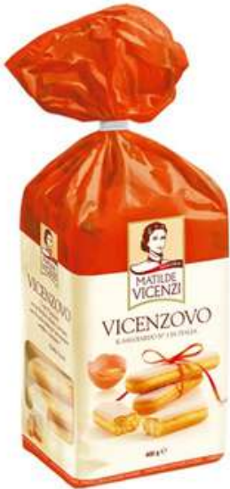
Savoardi per tiramisù Vicenzi.