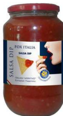
Salsa dip Fox.