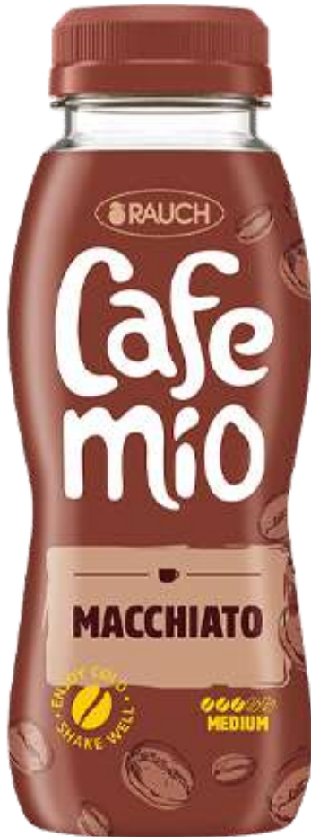
Caffè freddo gusto macchiato Rauch.