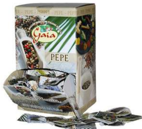
Pepe in bustine monodose.