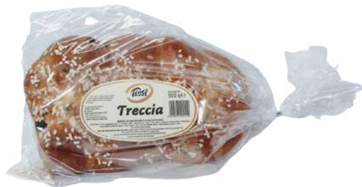
Treccia zuckerata Tissi.