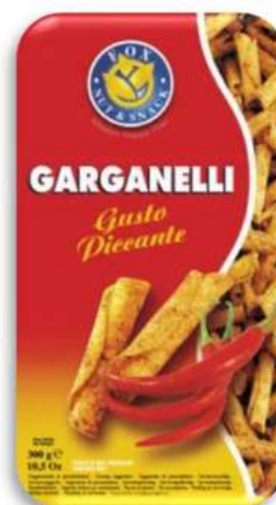
Patatine garganelli al gusto piccante.