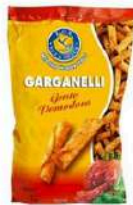
1 BUSTA GARGANELLI GR.300