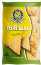
1 BUSTA TORTILLAS NATURALI GR.450