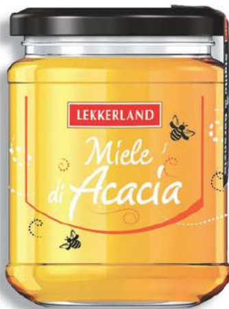
Miele di acacia Lekkerland.