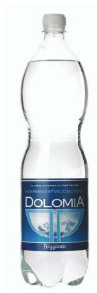
Acqua Dolomia minerale frizzante del Parco delle Dolomiti friulane.