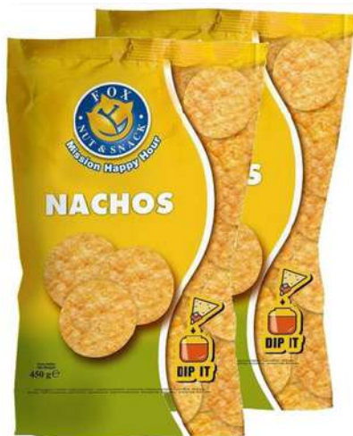
Patatine nachos Fox.