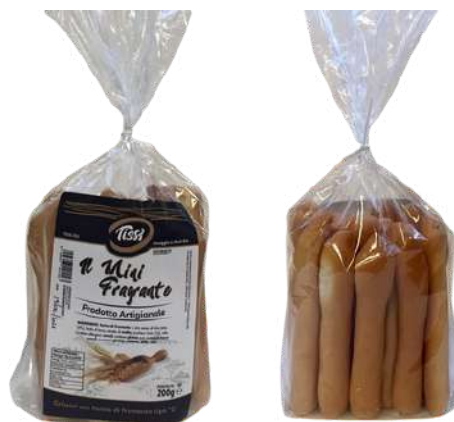
Grissino mini fragrante artigianale.