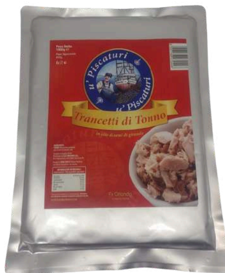
Trancetti di tonno all'olio d'oliva in busta.