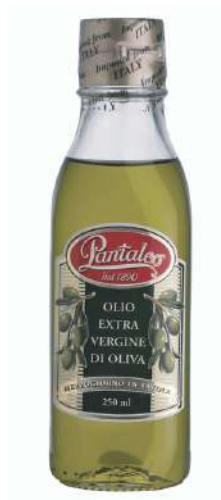
Olio extra vergine di oliva Pantaleo.