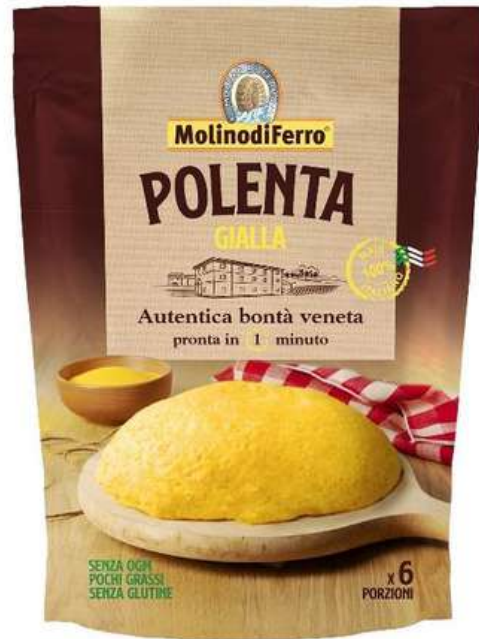
Farina per polenta gialla istantanea Molino di Ferro.