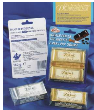
Cioccolato puro finissimo fondente Zaini.