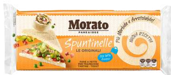
Spuntinelle Morato pane a fette per tramezzini.