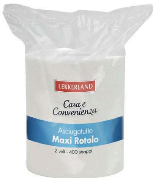
Maxi rotolo di carta assorbente 2 veli Lekkerland.