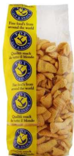
Patatine cornetti Fox.