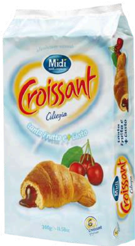
Croissant alla ciliegia Midi.