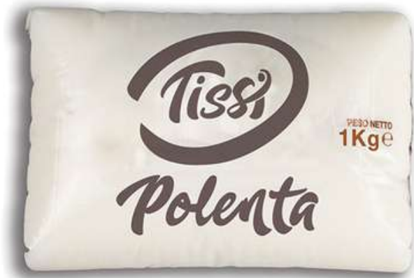
Polenta in panetto bianca e gialla da 1 Kg e 500 g.