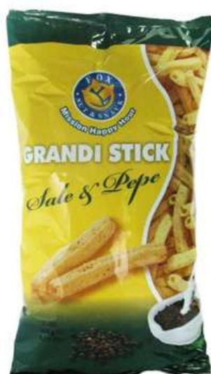
Patatine grandi stick al sale e pepe.