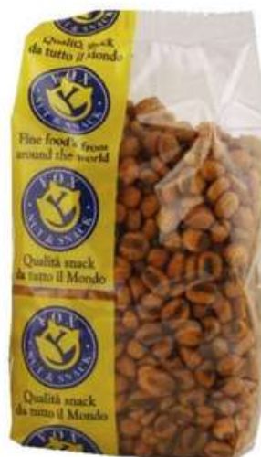
Mais tostato piccante Fox.