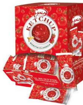
Ketchup in bustine monodose.