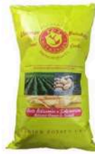
1 BUSTA VINTAGE ACETO BALSAMICO GR.300