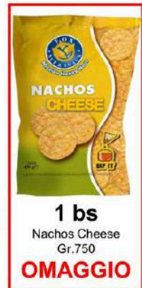
1 bs Nachos Cheese Gr.750 OMAGGIO

Assortimento misto di patatine e snack Aperiprimavera Fox.