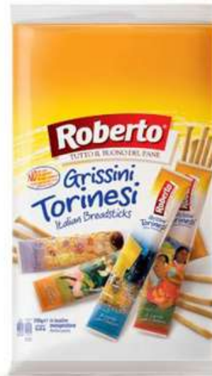
Grissini torinesi monoporzione Roberto.