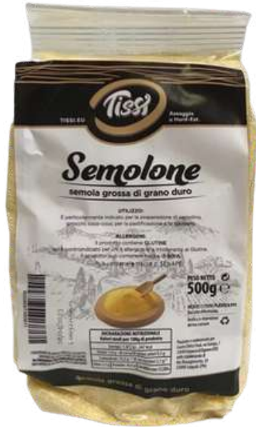
Semolino grosso in sacchetto.