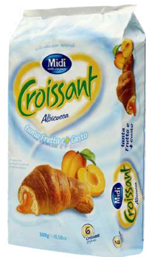
Croissant all'albicocca Midi.