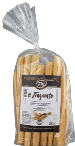
Grissino fragrante artigianale.