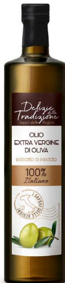
Olio extra vergine di oliva Delizie della Tradizione.