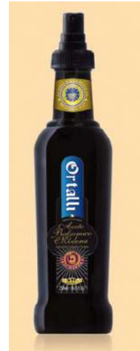
Aceto balsamico di Modena in spray Ortalli.