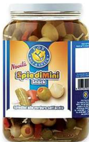
Mini spiedini di verdure sott'aceto.