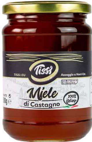
Miele di castagno Tissi.