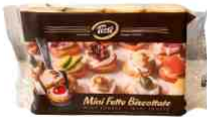
Mini fette biscottate Tissi.