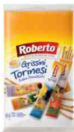
Grissini Torinesi monoporzione.