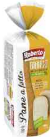
Pane affettato bianco con olio d'oliva Roberto.