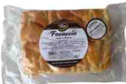
Tissi pane focaccia salata.