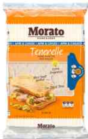
Tenerelle Morato pane a fette per toast.