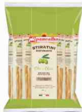
Grissini all'olio di oliva monoporzione.