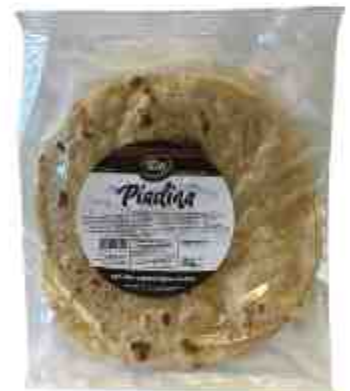
Piadina con olio extra vergine di oliva Tissi.