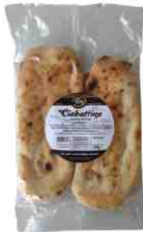
Tissi pane saltimbocca.