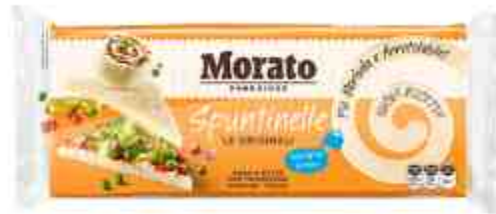
Spuntinelle Morato pane a fette per tramezzini.